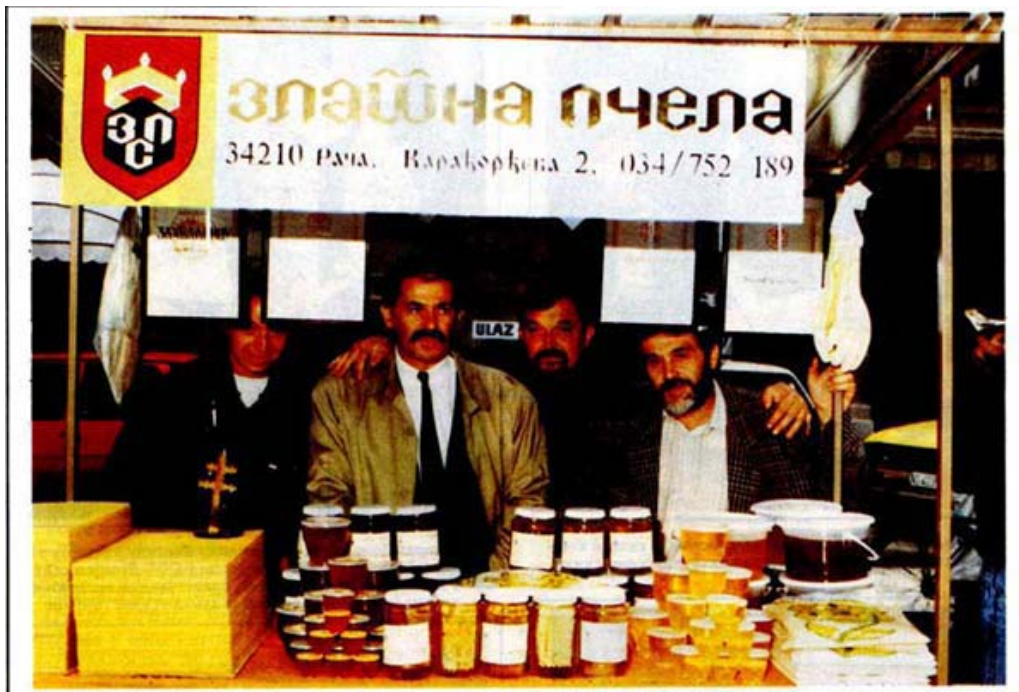
Штандови на фестивалу

Od 13. do 15. septembra u Novom Sadu je održan „Festival meda Novi Sad 96". Ova izložbena, prodajna, savetodavna, kulturna i humanitarna manifestacija okupila je ljubitelje pčelarstva, stručnjake za pčelarstvo, naučne radike i privredike iz svih krajeva Srbije, Crne Gore, Trebinja i Nove Tole kod Gradiške.